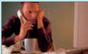
Stress am PC