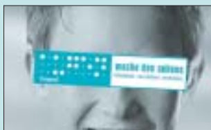
Logo der Woche des Sehens