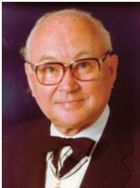
Prof. Meyer-Schwickerath entdeckte das Licht als augenärztliches Therapeutikum.

Die Sonne ist das zentrale Gestirn am Himmel, von ihr hängt alles Leben auf der Erde ab. Diese überragende Bedeutung war den Menschen seit Alters her bewusst. Viele frühe Kulturen verehr-