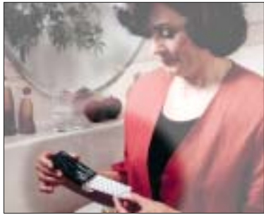
Eine Hormonersatztherapie kann in einem gewissen Ausmaß vor einem Grauen Star schützen.

Immer wieder gibt es Anzeichen dafür, dass der Ersatz fehlender weiblicher Hormone in den Wechseljahren nicht nur ein Segen ist: So musste 2002 eine große klinische Studie in den USA vorzeitig abgebrochen werden, weil die hormonbehandelten Frauen häufiger an Brustkrebs erkrankten oder einen Herzinfarkt erlitten. Andererseits waren bei ihnen Darmkrebs und Oberschenkelhalsbrüche seltener. Positiv scheint sich die Hormonersatztherapie auch auf das Risiko für eine Katarakt auszuwirken: In einer britischen Untersuchung sank dieses Risiko leicht. Die Wissenschaftler mahnen an, dass Vor- und Nachteile einer Hormonersatztherapie sorgfältig gegeneinander abgewogen werden sollten. (ac) ●