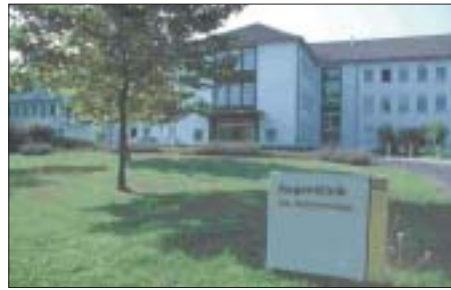
An der Uni-Augenklinik Bonn wird es auch weiterhin das Projekt „Patienten helfen Patienten“ geben.

Durch die finanzielle Förderung durch die BKK Nordrhein sei die Arbeit der Berater weiterhin möglich, vermeldet nun Pro Retina. Zwar arbeiteten die Berater ehrenamtlich, doch entstünden Kosten unter anderem für den Druck von Broschüren, anderem Informationsmaterial und für regelmäßige Schulungen. Die Pro Retina legt