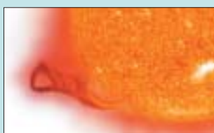
Sonne als Anstoß für Laser