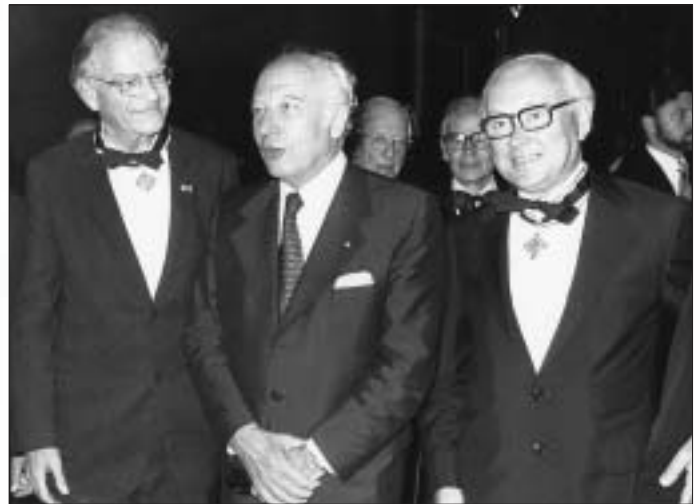
... und mit dem Atomphysiker Prof. Maier-Leibnitz und dem damaligen Bundespräsidenten Walter Scheel.

Der himmlische Feuerball und seine möglichen Folgen auf der Netzhaut: die zentrale Verbrennung auf der Retina, die Meyer-Schwickerath – ähnlich wie hier – bei einem Patienten beobachtete, ließ ihn über den Nutzen der Lichtenergie nachdenken.