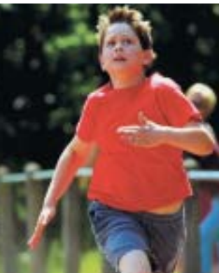
In einem roten Trikot läuft man jedem davon, meinen britische Forscher herausgefunden zu haben.

Ganz gleich, was die aktuelle Sportmode sagt: Wer siegen will, kommt an Rot nicht vorbei. Denn diese Farbe scheint ein besonderes visuelles Signal zu setzen und anzuspornen.