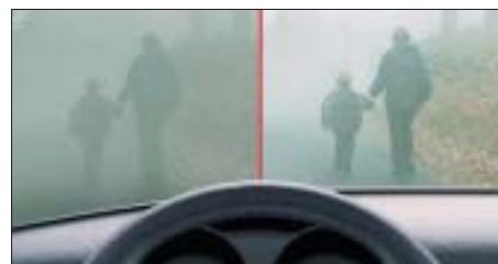
Der Vergleich macht den Unterschied überdeutlich: Links ist das funktionelle Sehen eingeschränkt, rechts ist es normal.

Am Tag spiele das Kontrastsehen eine geringere Rolle, obwohl die Tecnis®-Linse auch da unbestreitbar Vorteile und Verbes-